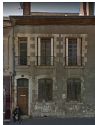
Périmètre de l'opération

Lancée en juillet 2019, l'opération OPAH-RU Carmes - Madeleine (Opération Programmée d'Amélioration de l'Habitat - Rénovation Urbaine) menée par Orléans Métropole a pour but de réhabiliter les immeubles et logements privés du quartier Carmes-Madeleine à Orléans. Cette opération, qui doit durer jusqu'en 2024, prévoit la réhabilitation de 200 logements sur la totalité de la période. Dans ce cadre, des aides financières ainsi qu'un accompagnement sont proposés aux propriétaires.